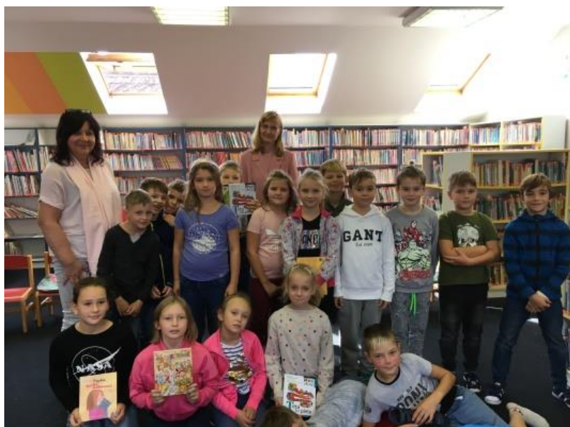
Žáci 3. ročníků

Na závěr besedy měli kluci a děvčata možnost nechat si podepsat novou knihu od paní spisovatelky a tím si obohatit své knihovny o nový přírůstek.